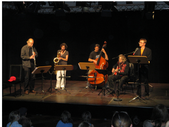
Aufführung 10. Juli 2009 im Theater Regensburg.

Doch dann lässt der alte Herr gar nichts mehr von sich hören, ist einfach verschwunden. Nur das Käppi, das er trug, liegt traumverloren da. Traurig nimmt es der kleine Max mit und setzt es zur Erinnerung auf, als er daheim zur Klarinette greift. Unglaublich, was da plötzlich aus seinem Instrument rauskommt: ungewohnt schräge, ein wenig verrückte Töne und doch rhythmisch verbunden ... Welche Abenteuer der kleine Max mit seinem Jazzkäppi noch erlebt, wird hier musikalisch und in Worten erzählt.